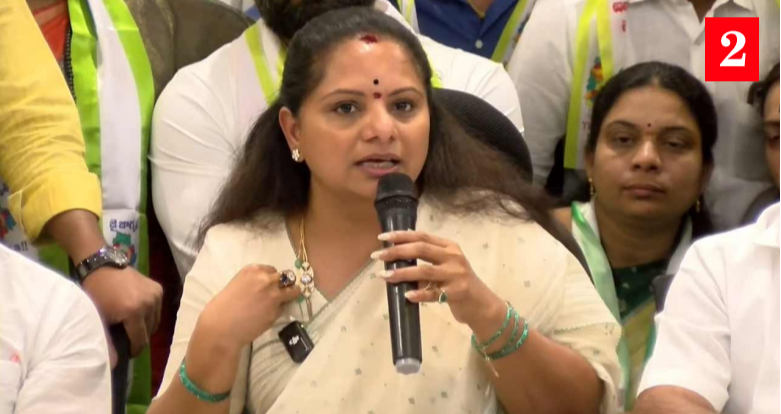
హైదరాబాద్: మహిళా జ్యోతిరావు పూలే ఆశయాలు సాధించే చట్టసభల్లో బీసీ మహిళలకు ఉప కోటా సాధించే వరకు విశ్రమించే ప్రస్థావన తీసుకుంటున్న కవిత