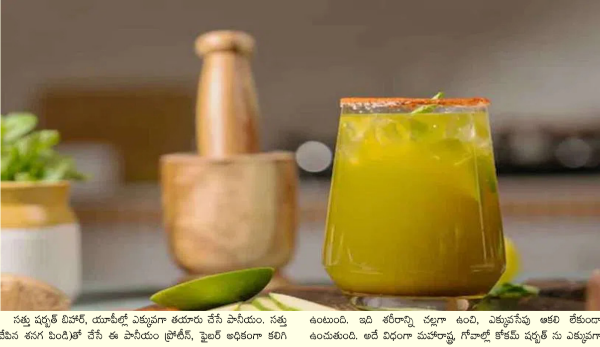
సత్తు షర్బత్ బిహార్, యూపీలో ఎక్కువగా తయారు చేసే పానీయం. సత్తు (వేసవి శనగ పిండి)తో చేసే ఈ పానీయం ప్రోటీన్, ఫైబర్ అధికంగా కలిగి ఉంటుంది. ఇది శరీరాన్ని చల్లగా ఉంది, ఎక్కువసేపు ఆకలి లేకుండా ఉంచుతుంది. అదే విధంగా మహారాష్ట్ర, గోవాలో కోకమ్ షర్బత్ ను ఎక్కువగా

వేసవి తీవ్రత పెరిగినప్పుడల్లా వేసవి పానీయాలను గుర్తు చేసుకుంటారు. చల్లదనం కోసం ఐస్ లాటిలు, కృత్రిమ రంగులతో ఉన్న సోడా (డింక్స్) కాదు, నేల నుంచే వచ్చిన సహజ పానీయాలే ఉత్తమం. పచ్చి మామిడి, పుడినా కలిపిన పానీయం నుంచి జీలకర్ర, కరివేపాకుతో చేసిన మజ్జిగ వరకు.. ప్రతి ప్రాంతానికి ప్రత్యేకమైన వేసవి పానీయాలు ఉన్నాయి. ఇవి ఆయుర్వేద సూత్రాలపై ఆధారపడి, స్థానిక వాతావరణానికి అనుగుణంగా రూపొందించిన తరతరాలుగా అభివృద్ధిచెందినవి. దేశంలో వేసవి కాలంలో ఎక్కువగా తయారు చేసే అత్యంత ప్రాచుర్యం పొందిన కొన్ని వేసవి పానీయాల గురించి ఇప్పుడు తెలుసుకుందాం. ఆమ్ల పన్నా, జల్జీరా, రంధాయి.. ఆమ్ల పన్నాను ఉత్తర భారత్ లో ఎక్కువగా తయారు చేస్తారు. పచ్చి మామిడితో చేసే ఈ పానీయం వేసవిలో అత్యంత ప్రాచుర్యం పొందింది. ఇది పుల్లగా, చల్లగా ఉండి శరీరానికి అవసరమైన ఎలక్ట్రైలైట్స్ ను అందిస్తుంది. ఎండ దెబ్బ నుంచి రక్షణ కలిగించడంలో ఇది సహాయపడుతుంది. జల్జీరాను రాజస్థాన్, ఉత్తర భారత్ లో ఎక్కువగా తయారు చేస్తారు. జీలకర్ర, చింతపండు, పుడినా కలిపి తయారు చేసే ఈ పానీయం జీర్ణక్రియను మెరుగుపరుస్తుంది. భోజనం ముందు తాగితే ఆకలి పెరుగుతుంది, వేసవిలో శరీరానికి చల్లదనం ఇస్తుంది. అలాగే రాజస్థాన్, యూపీలో రంధాయిని ఎక్కువగా తయారు చేస్తారు. పాలు, బాదం, సుగంధ ద్రవ్యాలతో తయారయ్యే రంధాయి శరీరానికి చల్లదనం ఇవ్వడమే కాకుండా పోషకాలను కూడా అందిస్తుంది. ముఖ్యంగా పండుగల సమయంలో ఎక్కువగా తీసుకుంటారు. సత్తు షర్బత్, కోకమ్ షర్బత్, మజ్జిగ..