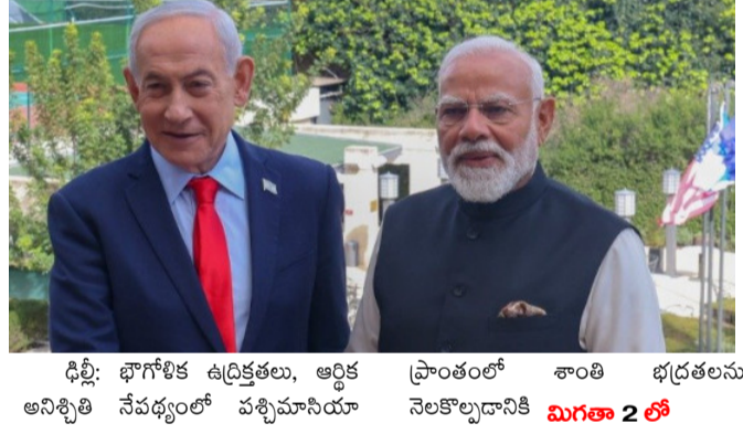
ధీల్లీ: భారత్ కు ఉద్దేశ్యం, ఆర్థిక ప్రాంతంలో శాంతి భద్రతలను అనిశ్చితి నేపథ్యంలో పశ్చిమాసియా నెలకొల్పడానికి మగతా 2 లో

పశ్చిమాసియాలో శాంతికి 'భారత్' ఒక్కటే మార్గం పశ్చిమాసియా స్థిరత్వంలో భారత్ ది కీలక పాత్రన్న ఇజ్రాయెల్ రాయబారి భారత్ ఆర్థిక వృద్ధి ద్వారా ఈ ప్రాంతానికి తీవ్రమైన డాలర్ లబ్ధి భారత్ ద్వారా ఇజ్రాయెల్ పట్ల క్రేజ్ లవ్ ఉందన్న ప్రధాని నెతనయూ