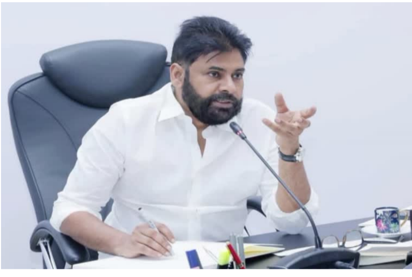
పన్నులను వేగవంతం చేయడంపై ఆంధ్రప్రదేశ్ ఉపముఖ్యమంత్రి పవన్ కల్యాణ్ ప్రత్యేక దృష్టి సారించారు. పంచాయతీలకు చెల్లించాల్సిన పన్నులను ఎగవేస్తున్న భారీ పరిశ్రమలు, ప్రైవేట్ విద్యాసంస్థలపై మగతా 2 లో

గ్రామ పంచాయతీల ఆర్థిక బలోపేతంపై పవన్ దృష్టి పన్నుల ఎగవేత దారులపై పవన్ కల్యాణ్ ఉక్కుపాదం.. డిఫాల్టర్ పరిశ్రమలు, విద్యాసంస్థలే టార్గెట్! పరిశ్రమలు, కార్పొరేట్ స్కూళ్లు, కాలేజీలు ఎందుకు పన్నులు చెల్లించడం లేదని ప్రశ్న అమరావతి: గ్రామ పంచాయతీల ఆర్థిక బలోపేతం, క్షేత్రస్థాయిలో పన్నుల